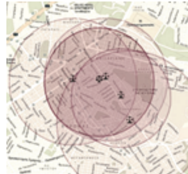
Εμφάνιση συντεταγμένων στο διαδίκτυο

Εάν 5 λεπτά από την εκκίνηση σας έρθει το πρώτο μήνυμα η ζυγαριά δουλεύει και είναι σωστά ρυθμισμένη εφόσον επιβεβαιώσετε πως τα στοιχεία του μηνύματος είναι σωστά. Περιμένετε μέχρι να ακούσετε το συνεχόμενο beer που σημαίνει ότι η ζυγαριά μπήκε σε κατάσταση χαμηλής κατανάλωσης. Προκαλέστε κατάσταση συναγερμού σηκώνοντας την ζυγαριά από το πίσω μέρος με κλίση μεγαλύτερη των 30 μοιρών. Μετά από 1 λεπτό θα σας έρθει μήνυμα συναγερμού.